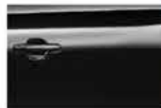
Черный (Elegance Black)