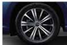
Колесные диски 18" из алюминиевого сплава