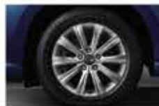
Колесные диски 17" из алюминиевого сплава