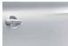
Белый (Pearl White)