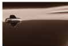
Коричневый (Mocha Brown)