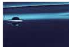
Синий (Peacock Blue)